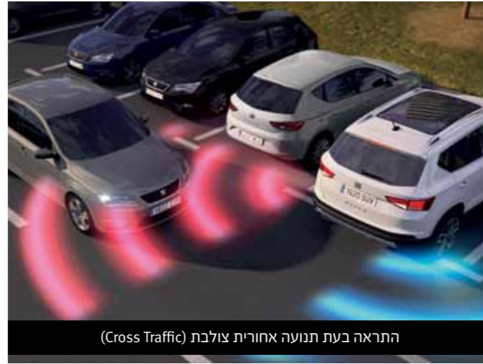
התראה בעת תנועה אחורית צולבת (Cross Traffic)