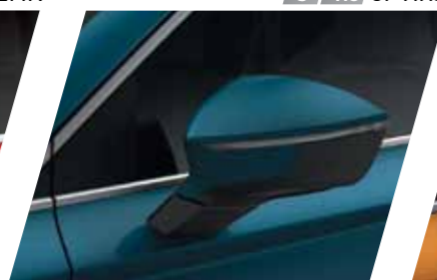
כחול 0F S / XC