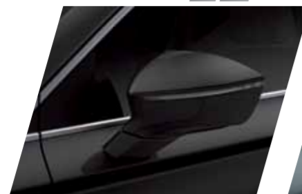
שחור 12 S / XC