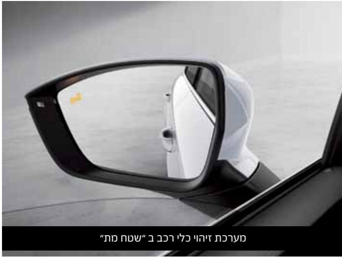
מערכת זיהוי כלי רכב ב"שטח מת"