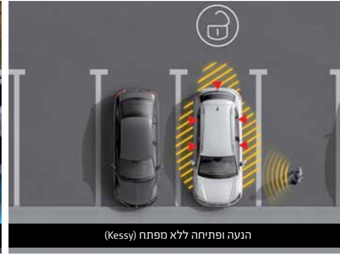
הנעה ופתיחה ללא מפתח (Kessy)