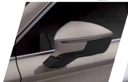
קפה 4K S