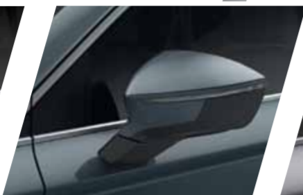
אפור F6 S