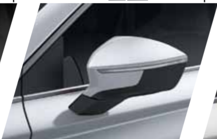
לבן נבאדה 2Y S / XC