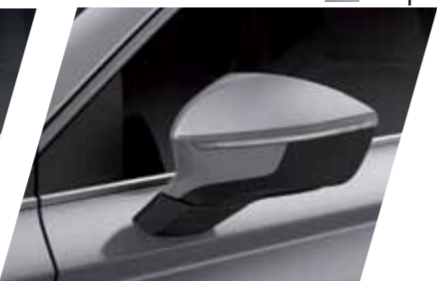
כסף 8E S