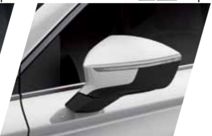
לבן 9P S / XC