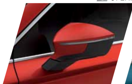
אדום 8T S